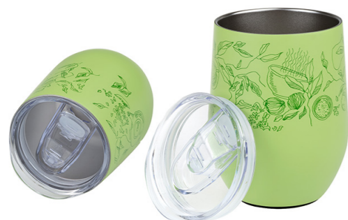
MUG O LATA VERDE