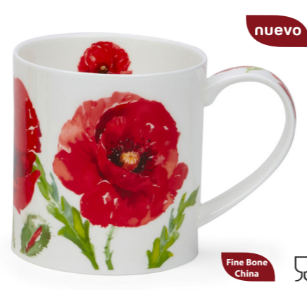
MUG ORKNEY FLORAL BLOOMS AMAPOLAS