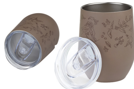
MUG O LATA MARRÓN