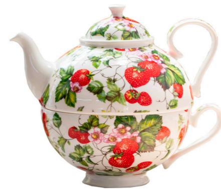
TEA FOR ONE FRESAS