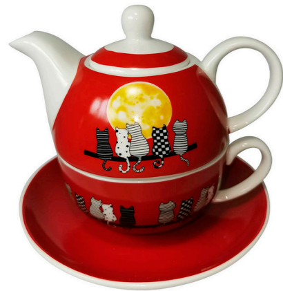
TEA FOR ONE GATOS