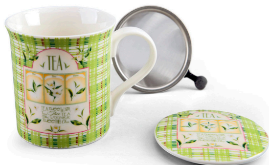
MUG CON FILTRO HERBAL TEA