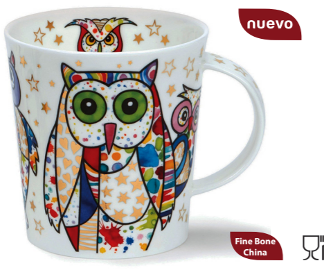
MUG LOMOND BLINGERS BÚHO