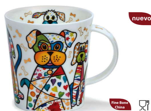
MUG LOMOND BLINGERS PERRO