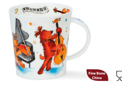
MUG LOMOND GROOVY DOGS