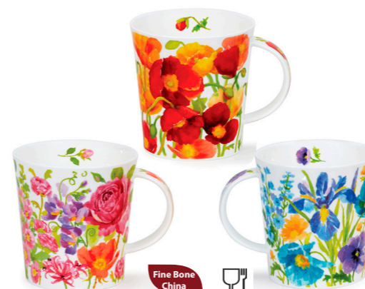
MUG LOMOND KELMSCOTT