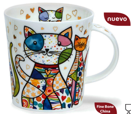
MUG LOMOND BLINGERS GATO