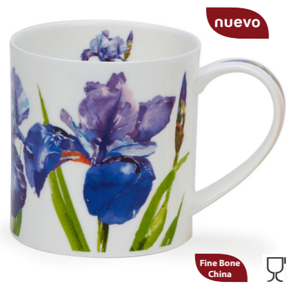
MUG ORKNEY FLORAL BLOOMS IRIS