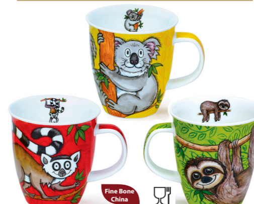
MUG NEVIS SWINGERS