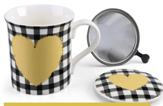
MUG CON FILTRO CORAZON