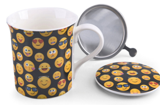
MUG CON FILTRO CARITAS