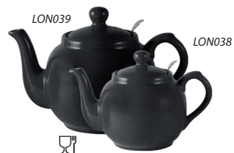
TETERA NEGRA CON FILTRO