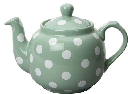
TETERA LUNARES VERDE FILTRO