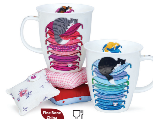
MUG NEVIS SLEEPY CATS