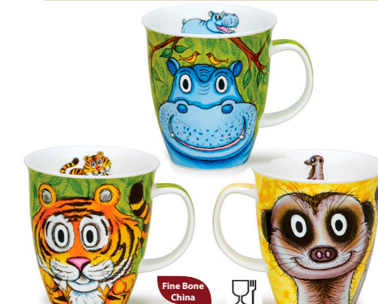
MUG NEVIS GO WILD