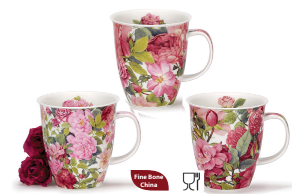
MUG NEVIS CHARTWELL