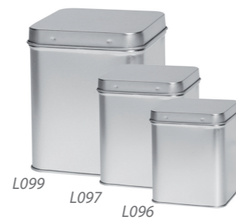
L099 L097 L096