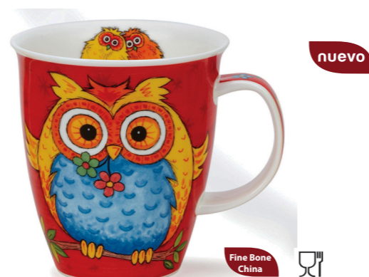
MUG NEVIS BÚHO